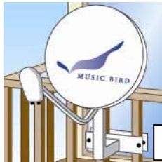
(A) ベランダ格子取付