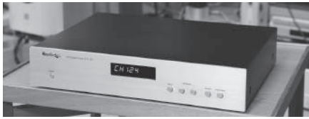
Conclusion C-T1CS オープン価格(参考売価¥123,619)高音質志向が徹底されたハイエンド・チューナー。DAC部にはウォルフソン・マイクロエレクトロニクス製 WM8741 をデュアルで採用し、受信系と音声信号系それぞれの電源部には専用トランスを搭載。スイッチ操作により96kHzへのアップサンプリングを行なうこともでき、さらには外部クロック入力端子まで備える点も見逃せない。真鍮削り出しの3点脚部、フロントパネルはアルミ削り出しと堅牢。アナログ出力2系統(RCA)、デジタル出力3系統(同軸×1、TOS×2)を装備する。大きさ430W×90H×340Dmm。重さ7.5kg ※ 機器に関する問い合わせ先：港北ネットワークサービス ☎045-507-3091