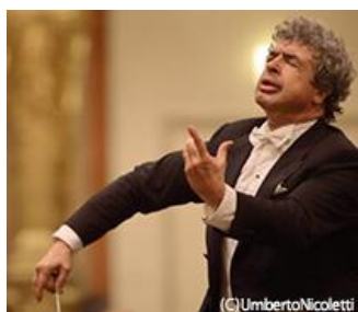
セミヨン・ビシュコフ