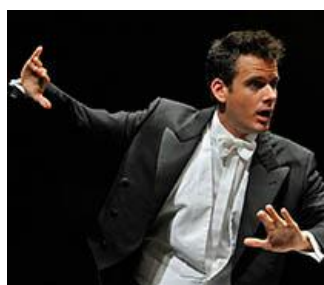
フィリップ・ジョルダン